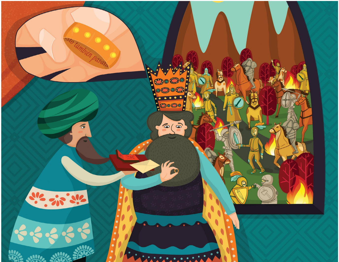
Ilustración realizada por Atentamente Consultores.